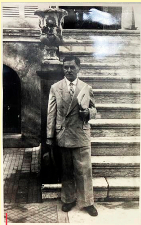
Foto de Kurt Unkel, que recebeu o nome indígena Curt Nimuendajú

A coordenação do projeto comemorou o encontro de documentos raros e de valor inestimável para a pesquisa científica. Entre outras preciosidades, registros, fotografias e um negativo em vidro do alemão Kurt Unkel (1883-1945), que recebeu o nome indígena Curt Nimuendajú pelos Apapokuva que viviam na Aldeia Guarani de região de Araribá (SP), com o qual se naturalizaria brasileiro e se consagraria com o maior etnógrafo no Brasil na primeira metade do século XX.